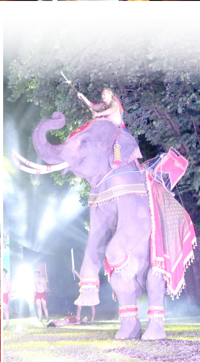
จังหวัดศรีสะเกษ Illustrative Organization โทรศัทพ์ : 045-814676

ชมฟรี! การแสดงแสง สี เสียง ตำนานการสร้างเมืองศรีสะเกษ เรื่อง “อารยธรรมแห่งศรีทธา มนตรา ศรีพุทธเศรษฐ” # ตอน สืบราชมรรคา ศรีขยราชา ชัยวรมันที่ 7